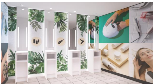
【掲出期間・掲出料】